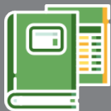
Cahier de fertilisation