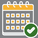
Plan prévisionnel de fumure